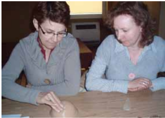
Szkolenie w Białymstoku

nie do okresu umierania /chorym i rodziną - uczestniczka z Białegostoku.