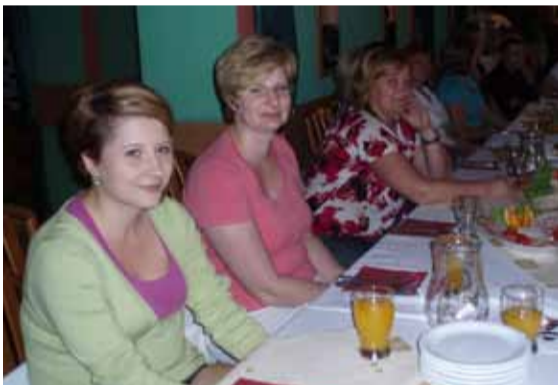
Szkolenie w Krakowie

Materiał wykładów przedstawiony w profesjonalny, ciekawy, przejrzysty sposób. Bardzo ciekawe zajęcia warsztatowe z psychologii oraz ćwiczenia z samobadania piersi. W moim odczuciu szkolenie super! - pielęgniarka z Krakowa;