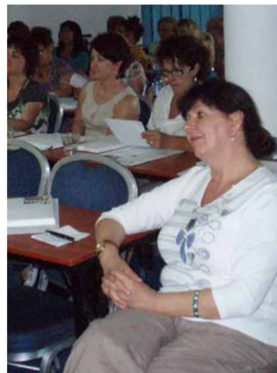
Szkolenie w Olsztynie

Uczestniczki szkolenia w ankietach ewaluacyjnych pisały: Pozyskana wiedza będzie bardzo przydatna w mojej pracy, zwłaszcza zagadnienia z komunikacji z chorym i jego rodziną oraz pokaz samobadania i samoobserwacji - szkolenie w Olsztynie; Uzyskana wiedza pozwoli mi poczuć się pewniej w kontaktach z chorym i jego bliskimi, pomoże mi