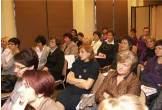
Szkolenie w Warszawie

Chory onkologiczny wymaga szczególnego traktowania - bywało, że miałam z tym problem. Wszystkie tematy bardzo przydatne - szkolenie w Warszawie;