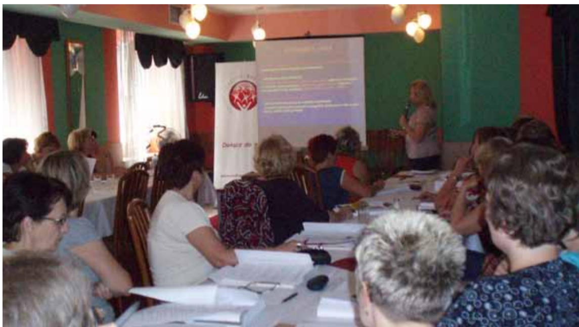
Szkolenie w Krakowie

Od października ubiegłego roku Stowarzyszenie Polskie Amazonki Ruch Społeczny realizuje edukacyjny Projekt „Minimum onkologiczne dla pielęgniarek podstawowej opieki zdrowotnej” skierowany do pielęgniarek środowiskowych i rodzinnych z małych miejscowości i wsi, finansowany z grantu przyznanego Stowarzyszeniu przez Fundację Bristol Myers Squibb.