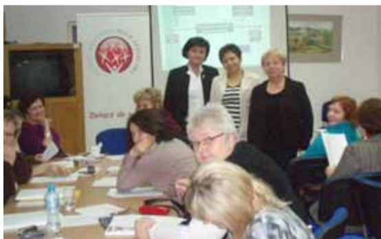
Szkolenie w Bydgoszczy

Szkolenia odbywały się w miastach wojewódzkich, co było korzystne ze względu na dogodny dojazd pielęgniarek z małych miejscowości. Po sprawdzeniu naszego poziomu wiedzy przed szkoleniem zaczęły się wykłady i warsztaty. Zajęcia miały charakter interaktywny, więc miałyśmy możliwość dyskusji i wyjaśniania wątpliwości na bieżąco. Następnego dnia znów od rana nauka - głównie psychologia i psychoonkologia. Szkolenie kończyło się testem sprawdzającym wiedzę i jak przed każdym sprawdzianem zawsze było trochę emocji. Po wspólnym sprawdzeniu testu i podliczeniu zdobytych punktów otrzymałyśmy certyfikaty ukończenia szkolenia. Niebagatelne znaczenie ma również to, że wszystkie koszty szkolenia, tj. zakwaterowania, wyżywienia i materiałów szkoleniowych pokrywał organizator.