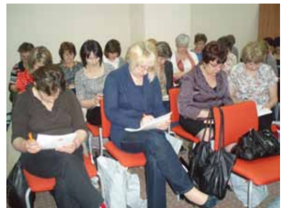
Szkolenie w Kielcach

Pielęgniarki środowiskowe i rodzinne, ze względu na pracę w środowisku chorego, mają kontakt z pacjentami w różnym wieku i z różnymi schorzeniami. Wymaga to od nich specyficznych umiejętności, w szczególności nawiązywania i podtrzymywania kontaktu z chorym i jego rodziną oraz przekazywania wiedzy na temat zdrowia i postępowania w chorobie, różnym ludziom i grupom społecznym. Z tego względu każda inicjatywa, której celem jest przygotowanie pielęgniarki rodzinnej do jak najlepszego pełnienia swojej roli, jest jak najbardziej godna poparcia.